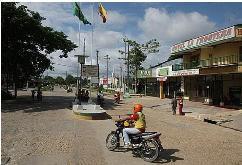
Frontera de Leticia con Tabatinga