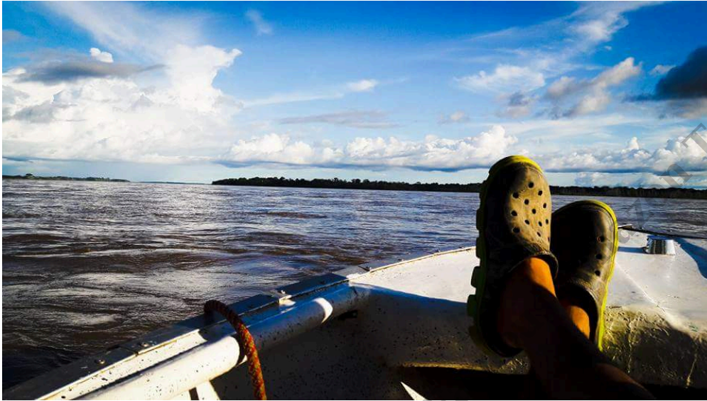
Tour crucero por el Rio Amazonas

Este artículo te da una buena referencia de los planes en el Amazonas: Conozca lo mas exotico en excursiones, planes y tours en Leticia Amazonas