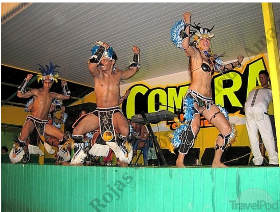
Baile de las garotas en la comara show club

09:00 Pm- Otra vez en la casa descansando para el lunes empezar con todas las energías