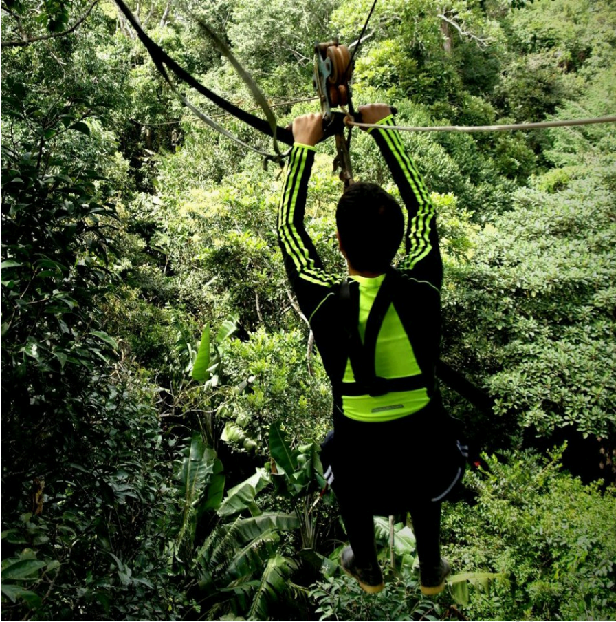
Escalada, Dosel y Canopy en Arboles Leticia Amazonas

12:00 Am - Almorzamos en nuestro vecino país de Perú un delicioso Chicharrón de Pirarucu