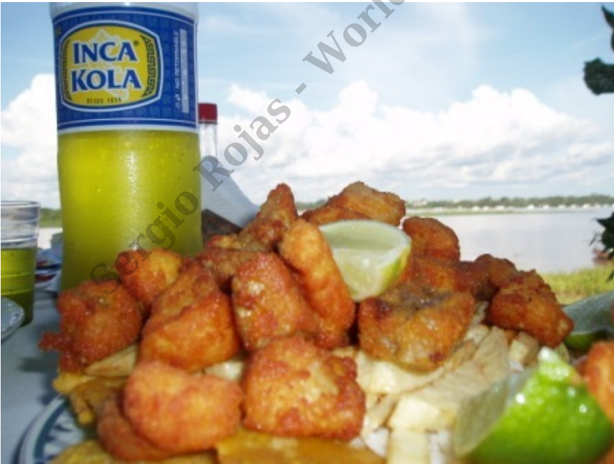
Chicharron de Pirarucu en Santa Rosa Peru

12:00 Am - Almorzamos en nuestro vecino país de Perú un delicioso Chicharrón de Pirarucu